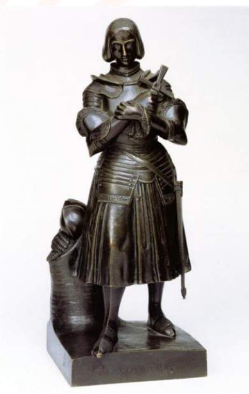
Links | Uitgave Greta Thunberg. Rechts | Jeanne d'Arc. Marie van Orleans, ca. 1830 Bruikleen Dordrechts Museum.